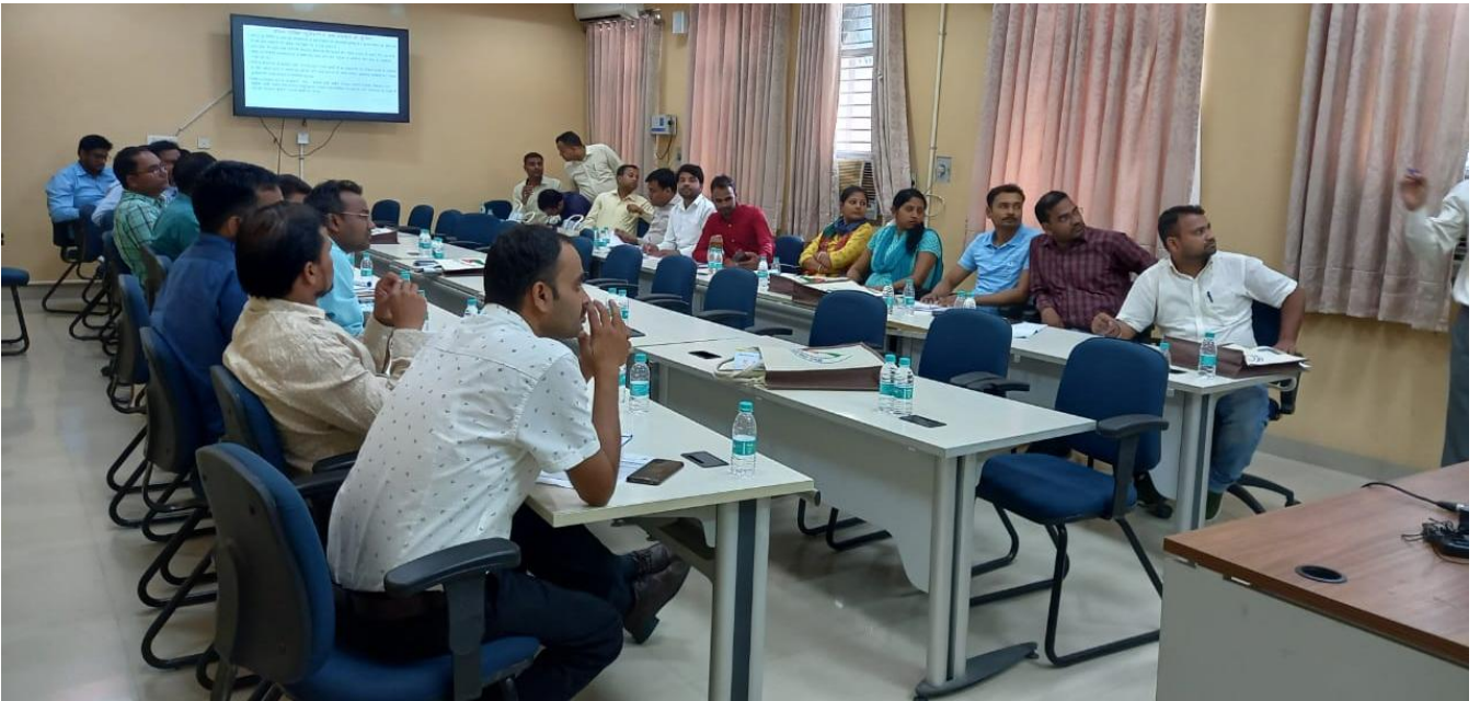
पंचायती राज पदाधिकारियों का दो दिवसीय मास्टर ट्रेनर प्रशिक्षण