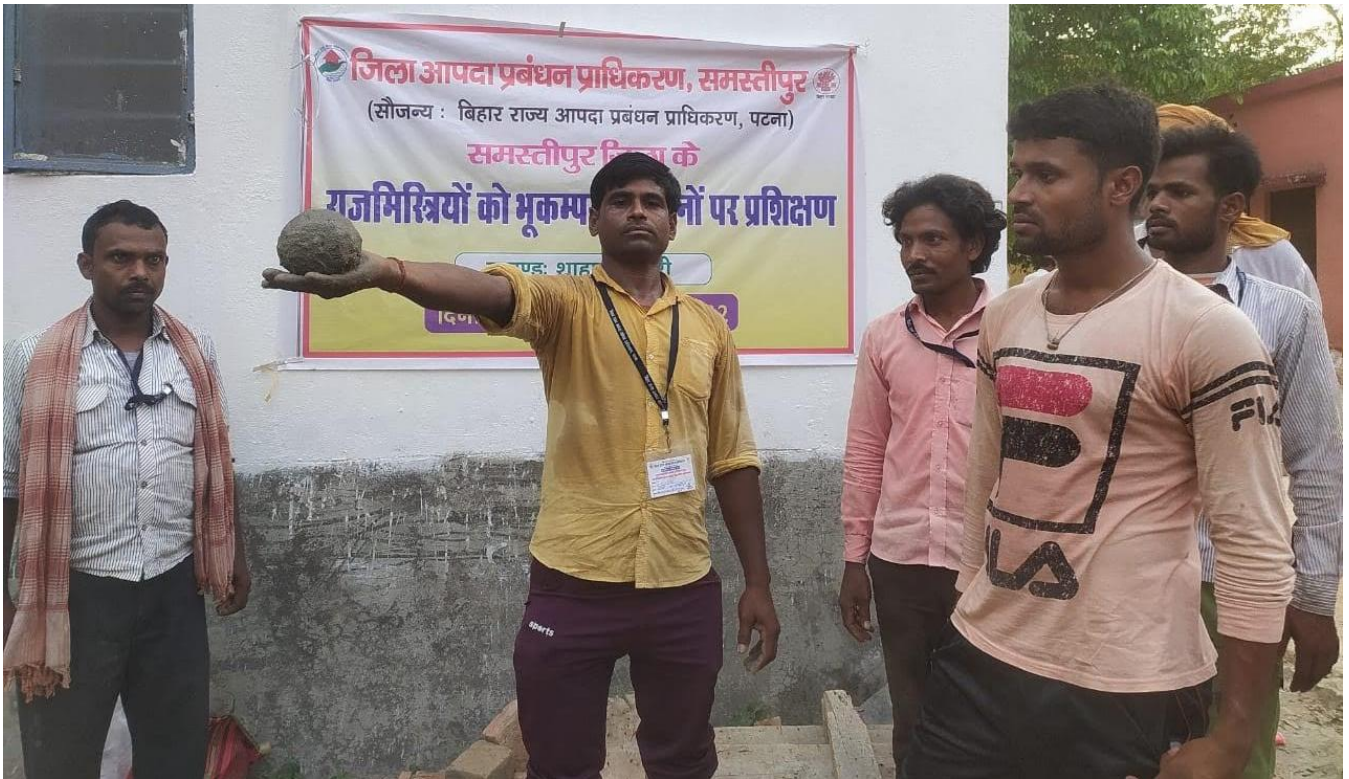
राजमिश्रियों के प्रशिक्षण का दृश्य