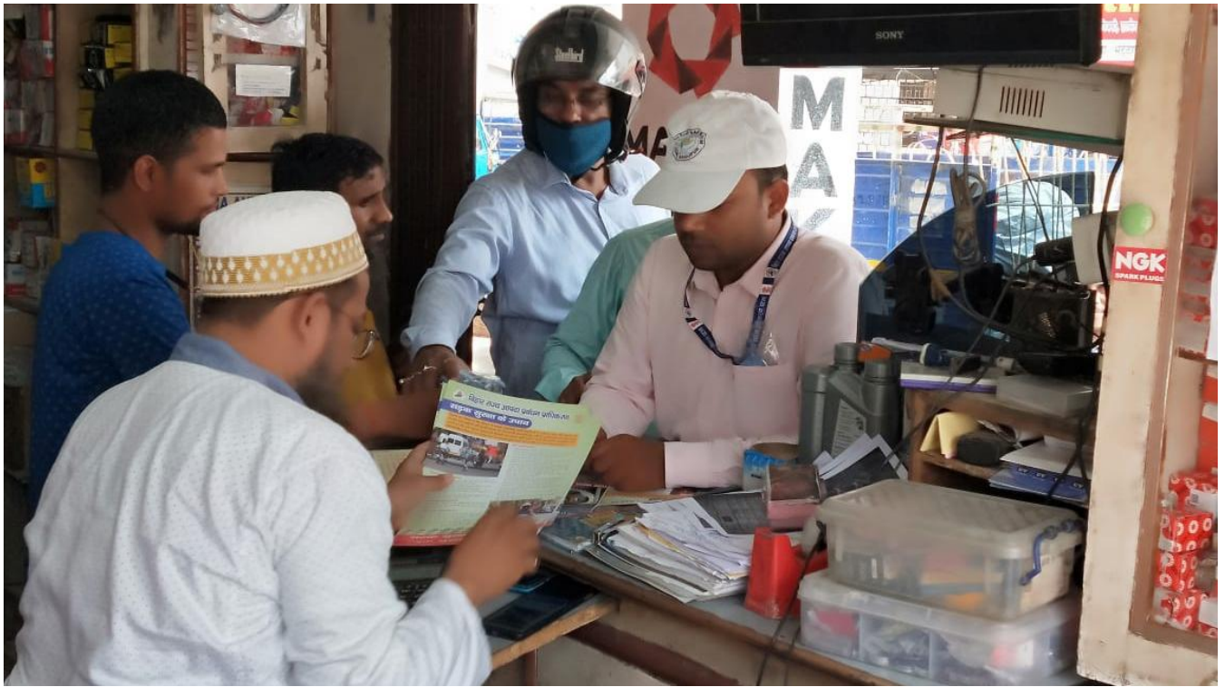
सड़क सुरक्षा जागरूकता कार्यक्रम: मोटर पार्ट्स दुकानों में पंपलेट का वितरण