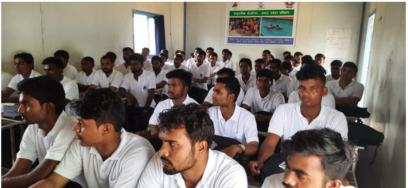
कम्यूनिटी वॉलेंटियर ट्रेनिंग का एक दृश्य