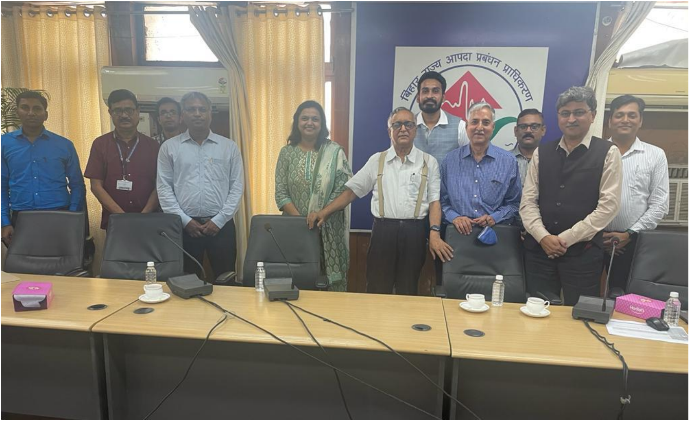
राष्ट्रीय कौशल विकास निगम के अधिकारी प्राधिकरण कार्यालय में