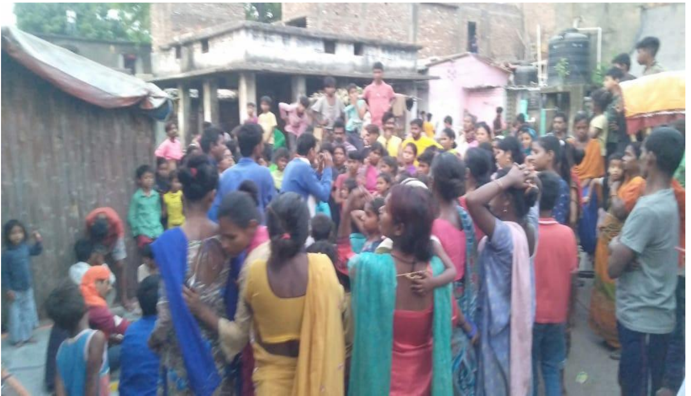
अग्नि सुरक्षा सप्ताह: नुक्कड़ नाटक देखते दर्शक