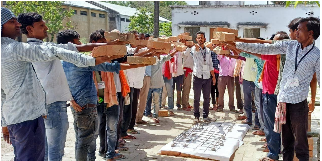
भूकंपरोधी भवन निर्माण के लिए प्रशिक्षण लेते राजमिस्त्री